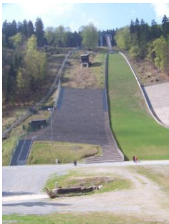
Skisprungschanze in Willingen